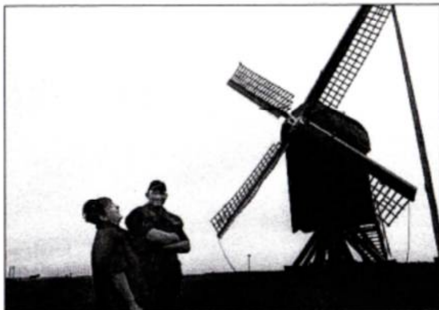
De molen in Ter Haar blijft verzekerd van wind.

De zesde molen die we bezochten was molen de Kok op een eiland in de Kagerplassen. Tijdens mijn studie ben ik eens een keer wezen zeilen op deze plassen en toen viel me deze molen al op. Heel erg klein en knus.