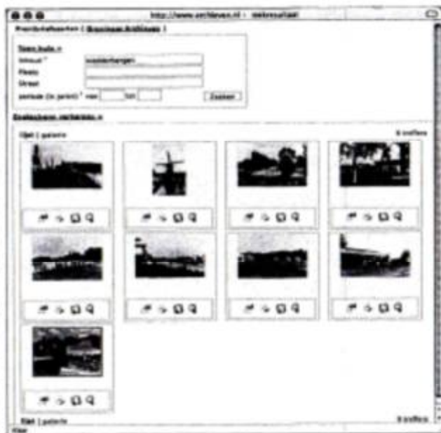
Een venster met zoekresultaten