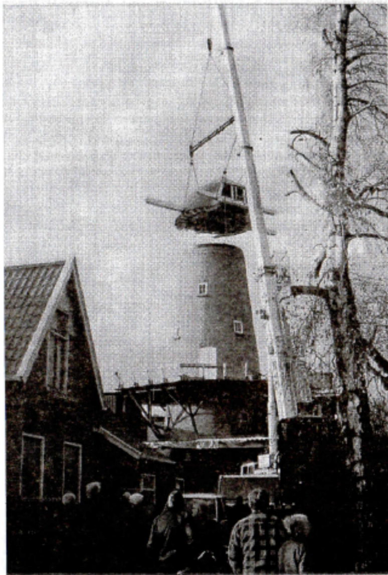
Nieuwe Pekela 24 november 2000