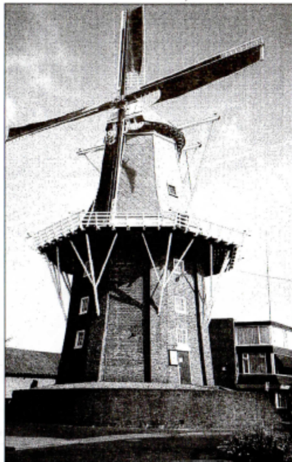
■ Molen Adam in volle glorie.

De vrijwilligers, die de molens in de gemeente Delfzijl bedienen, hebben veel waardering voor de zorg en aandacht van de gemeente Delfzijl voor deze monumenten. Molen Adam is opengesteld voor rondleiding op de zaterdagmiddag van 14.00 tot 17.00 uur.