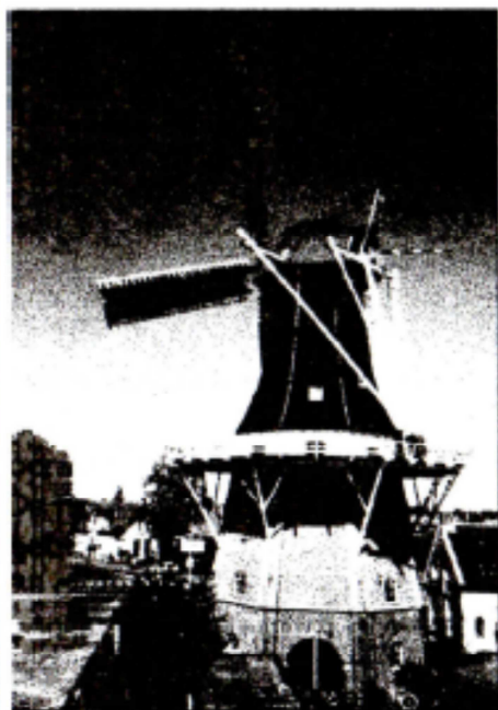
Molen Edens, staande vlakbij De Klinker, alwaar men een complex van plm. 16,50 hoog bij wil bouwen

Een jaar geleden hebben de verschillende molenorganisaties hun bezwaarschriften tegen de bouw van een flat met 4 woonlagen bij molen Berg ingetrokken nadat de gemeente schriftelijk had toegezegd met de molenwereld afspraken te zullen maken voor er nieuwe bouwplannen in de omgeving van de molens in procedure gebracht zouden worden. De gemeente lapt deze afspraak aan de laars. Ondanks diverse pagingen het overleg over molenbeschermingszones op gang te brengen liet de gemeente niets van zich horen en heeft het in november j.l. een bouwplan voor de uitbreiding van De Klinker met kantoren, plaatselijk plm. 16,50 m hoog, in procedure gebracht. De verschillende molenorganisaties zoals De