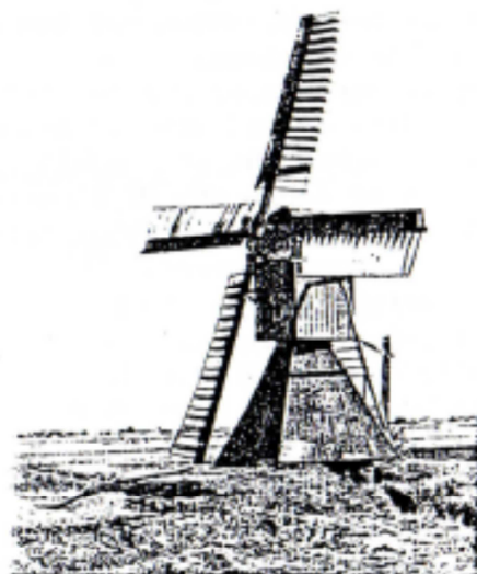
Verloofde spreker bij de Erenburg onder Midwilt

Allen welkom bij de club en natuurlijk tot ziens op cursus of bij de NIEUWJAARSVISITE OP ZATERDAG 2 JANUARI OM HALF 11.